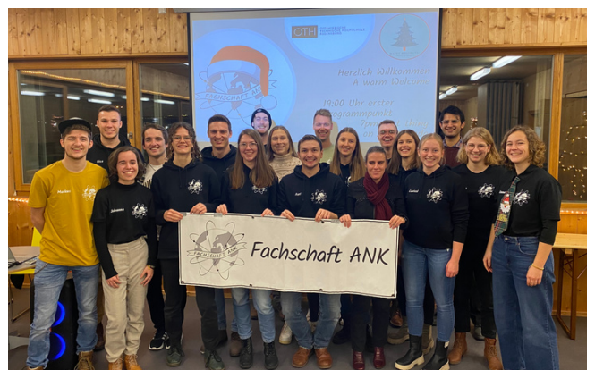
Die Fachschaft ANK