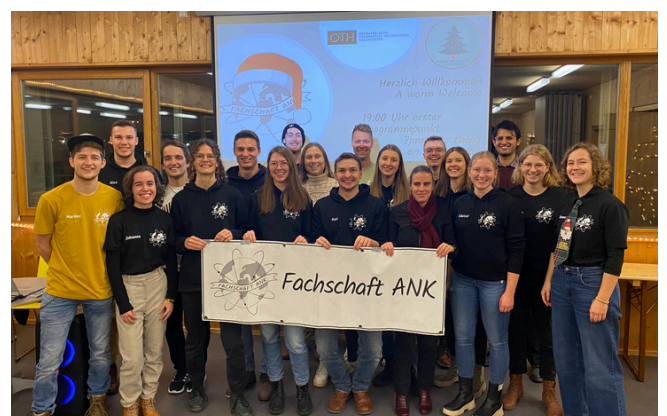
Die Fachschaft ANK