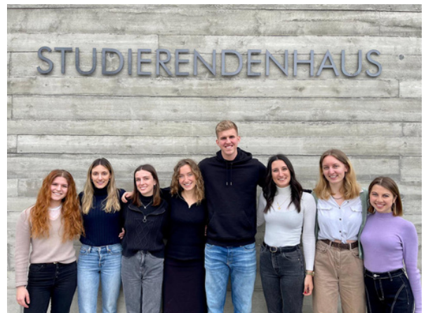
Der Vorstand des IRM network e.V.